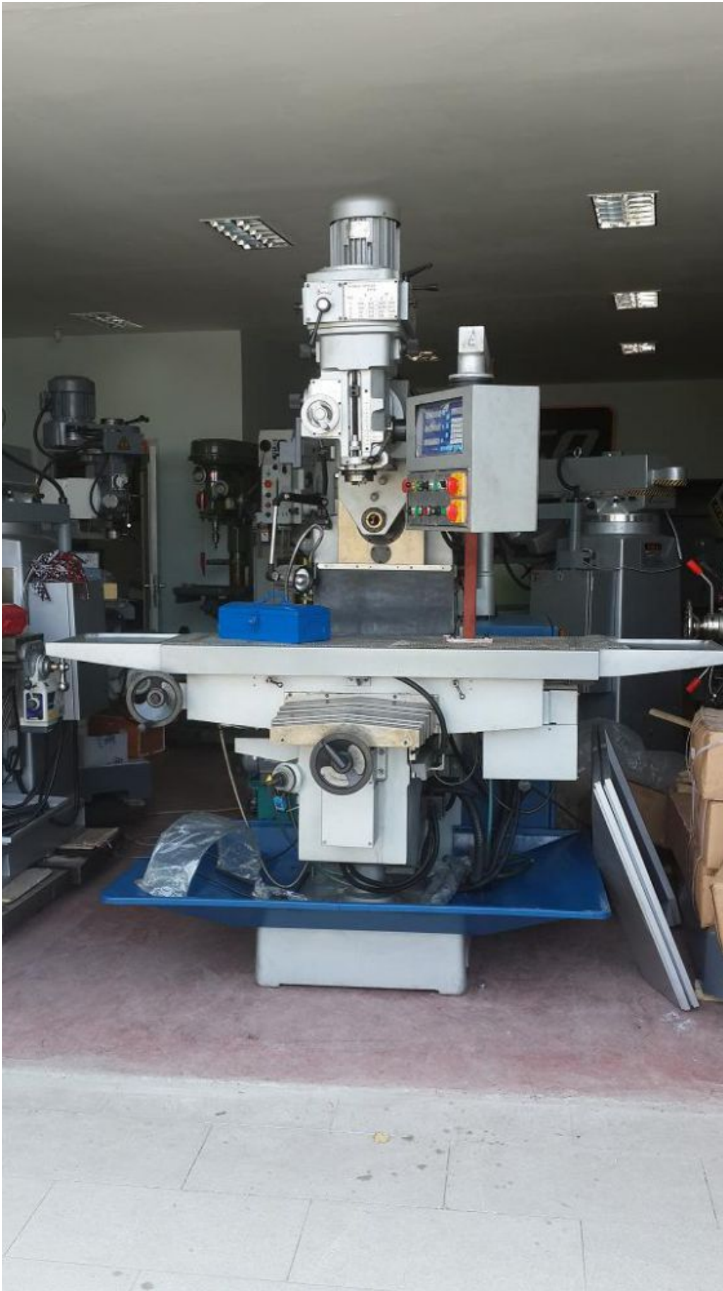
FALCO Molder Milling