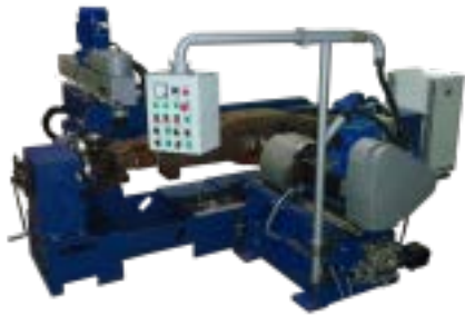
Railway Milling Machine